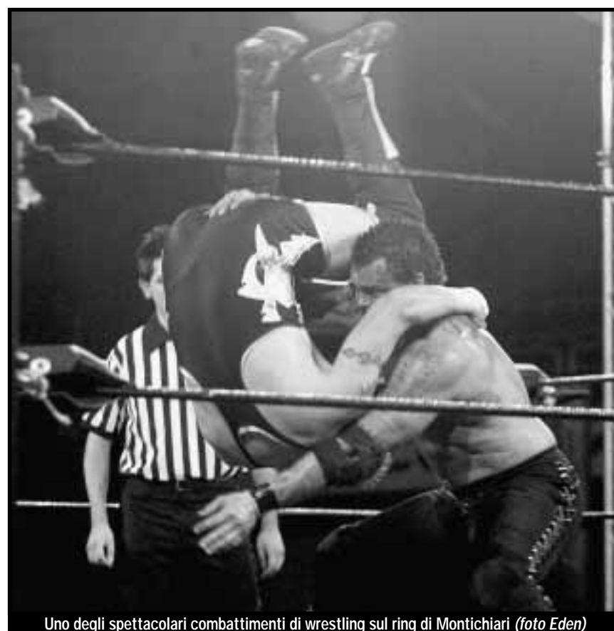
Uno degli spettacolari combattimenti di wrestling sul ring di Montichiari

Mancavano soltanto alcuni elementi annunciati: le telecamere di Sky e